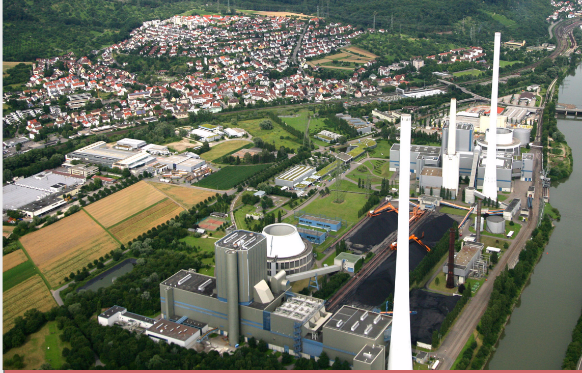
5 Die historisch gewachsene Gemeinde "Altbach" tritt gegenüber dem massiven Kohlekraftwerk in den Hintergrund. Eine gute Durchgrünung und helle Farben puffern dagegen die störende Wirkung