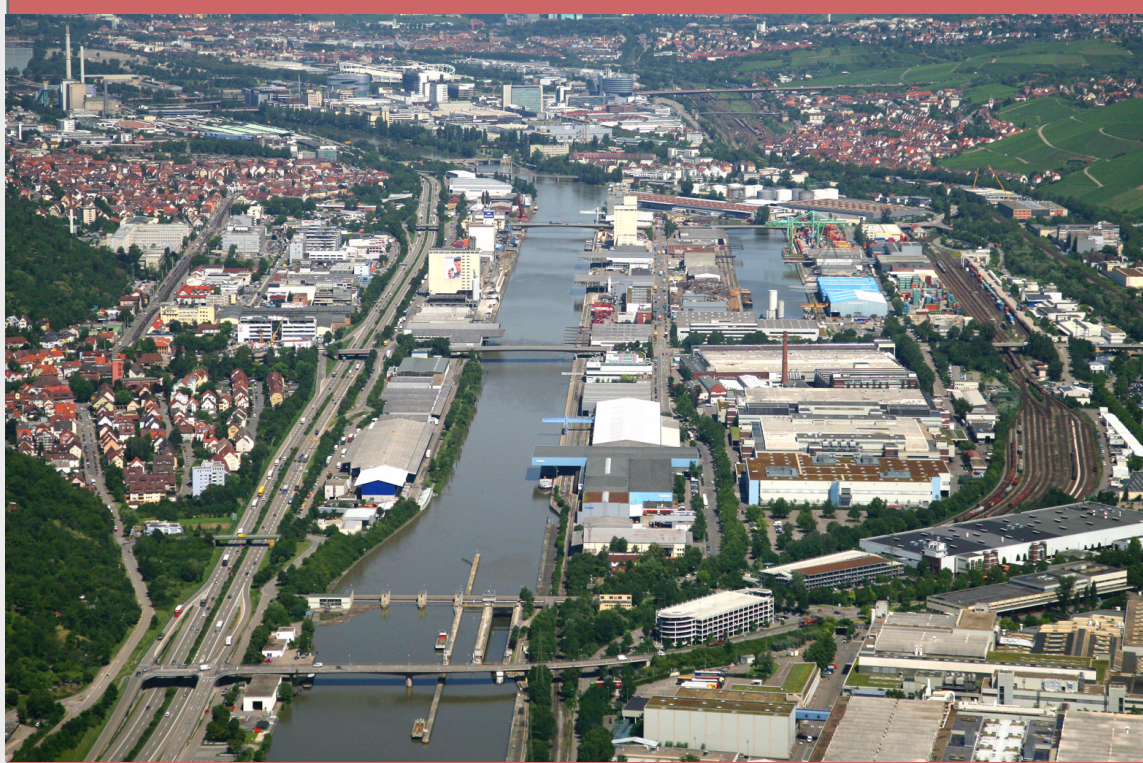
4 Siedlungsdruck, großflächige Industrieareale und Erschließungstrassen wie die B 10 und Bahnareale füllen den Großteil des Tals aus und degradieren den Neckar zur kanalisiert Wasserstraße. Eine Naherholungsfunktion am Fluss ist hier nicht mehr gegeben