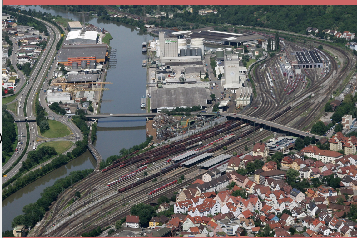
7 Der Westen Plochingens wird stark von dem mächtigen Gleiskörper, dem Hafen- und Industrieareal dominiert. Bezüge zum Neckar und "grüne Korridore" sucht man in diesem Bereich vergeblich