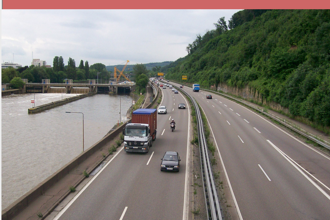
6 Die vierspurige B 10 ist eine wichtige Transport- und Verbindungsachse im Neckartal. Für Kommunen wie Esslingen oder Deizisau stellt sie eine nur schwer zu überwindende Barriere und starke Lärmquelle dar