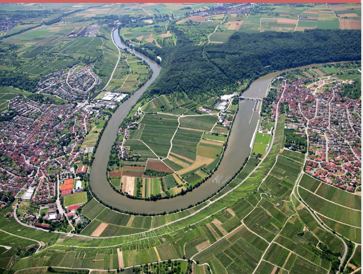
Bild 8: Im Luftbild werden die Bezüge von Mundelsheim und Hessigheim zum Neckar deutlich. Geringe Barrierewirkungen und wenig Gewerbeflächen in Flussnähe sind eine Seltenheit im Untersuchungsraum