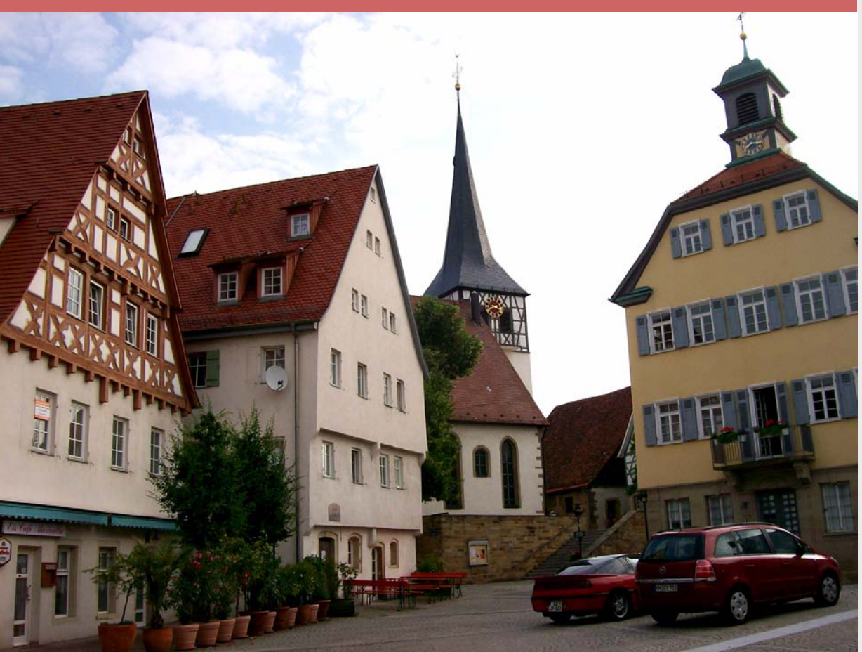
Bild 5: Der historische Ortskern von Kirchheim am Neckar, mit dem Rathaus auf der rechten Seite