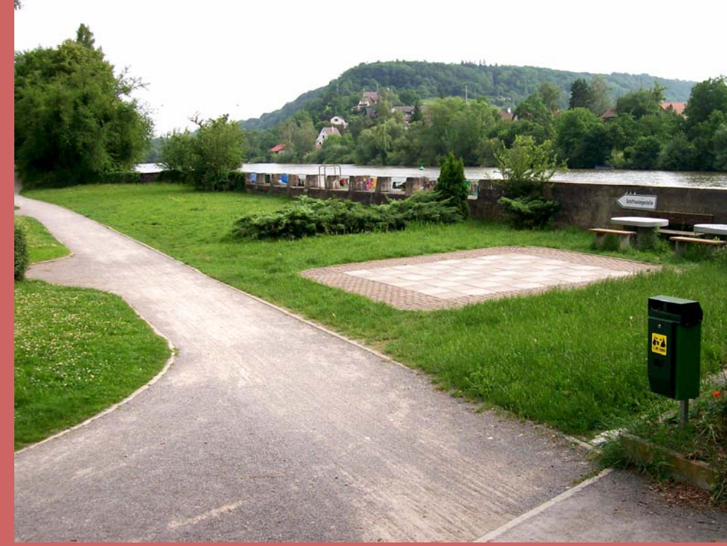
Bild 3: Die Aufenthaltsfläche in Mundelsheim wird durch die Hochwasserschutzmauer beeinträchtigt