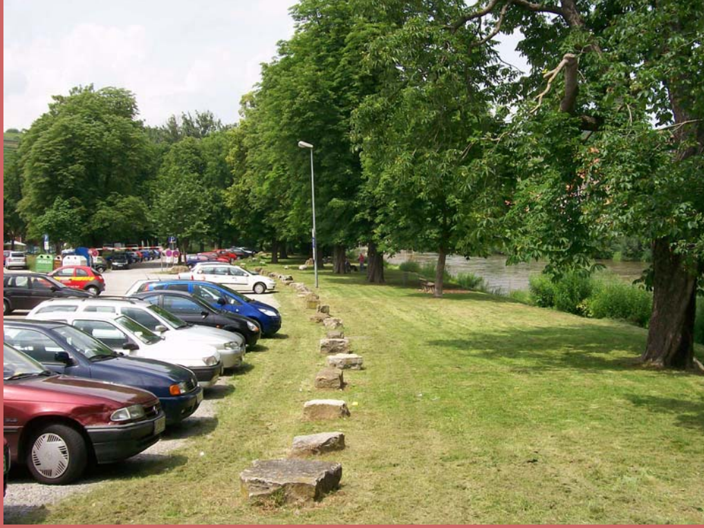
Bild 2: Besigheim besitzt bereits gute Bezüge Richtung Enz. Parkplätze und Grünflächen könnten jedoch besser strukturiert werden