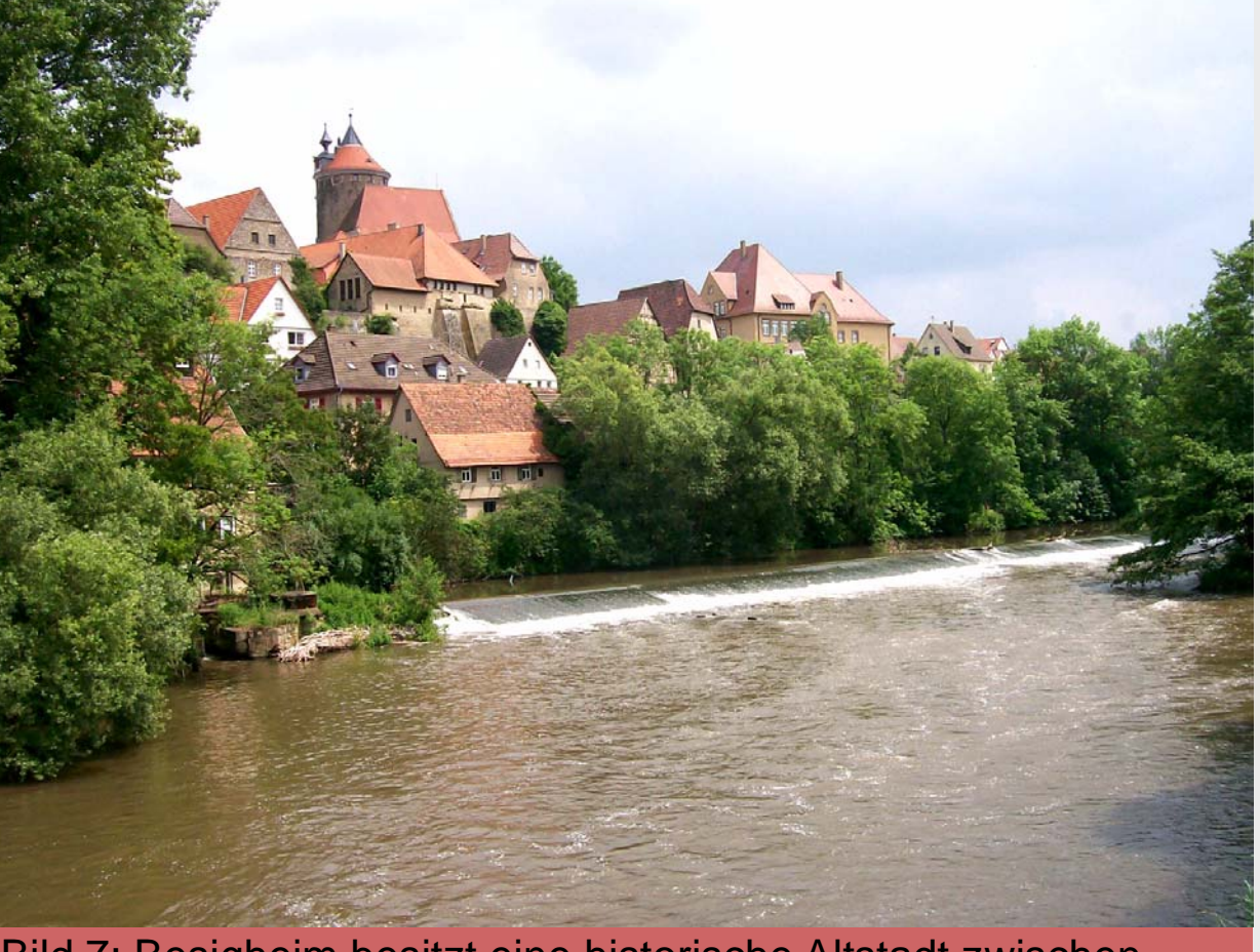
Bild 7: Besigheim besitzt eine historische Altstadt zwischen der Enz und dem Neckar