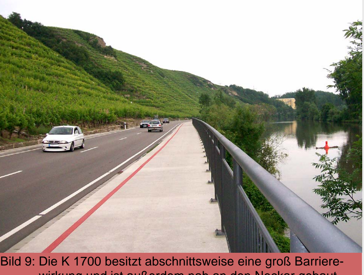
Bild 9: Die K 1700 besitzt abschnittsweise eine große Barrierewirkung und ist außerdem nah an den Neckar gebaut worden