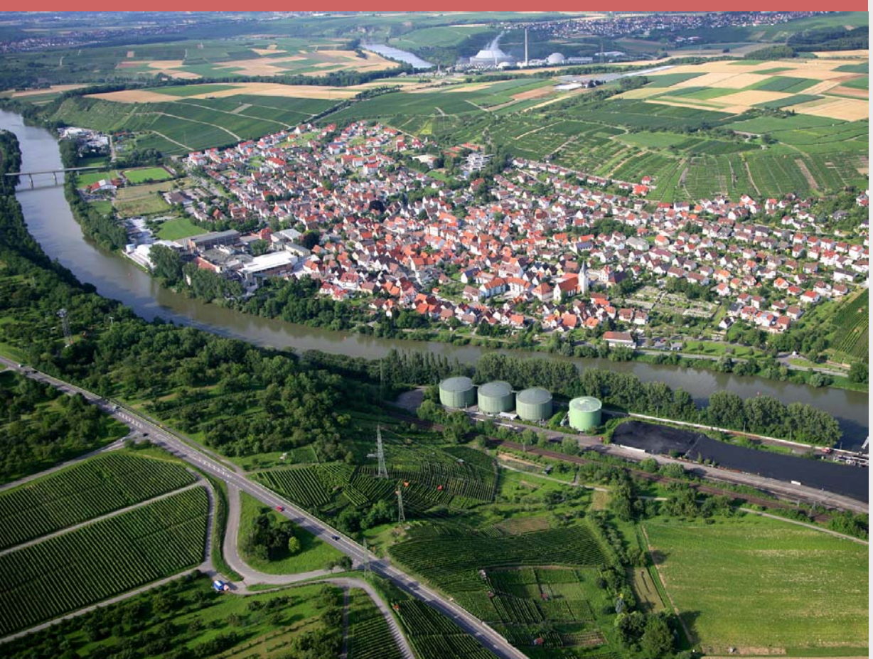
Bild 6: In Gemmrigheim reichen Industrie- und Gewerbeflächen auch an den Neckar. Es besteht jedoch ein schöner Uferweg mit Anbindungen an den Ortskern