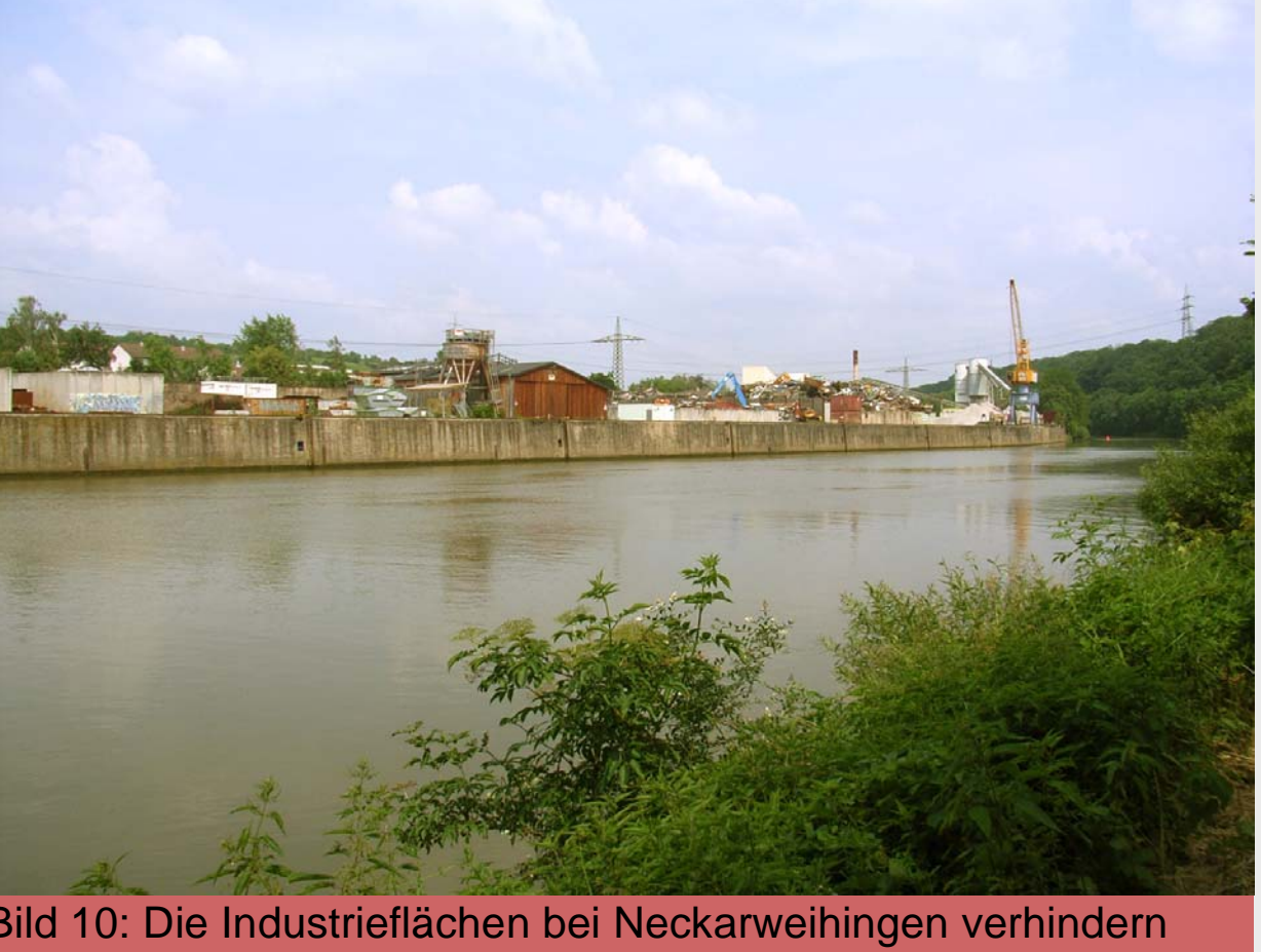
Bild 10: Die Industrie- und Gewerbeflächen bei Neckarweihingen verhindern generell Bezüge zwischen Siedlung und Fluss. Das Ufer ist durch eine Hochwasserschutzmauer komplett verbaut