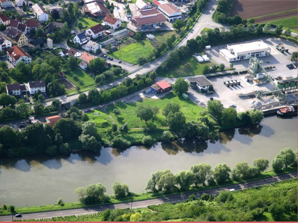
Bild 1: In Walheim trennt die B 27 den Ort vom Neckar ab. Zwei Unterführungen überwinden hier im Bild diese Barriere