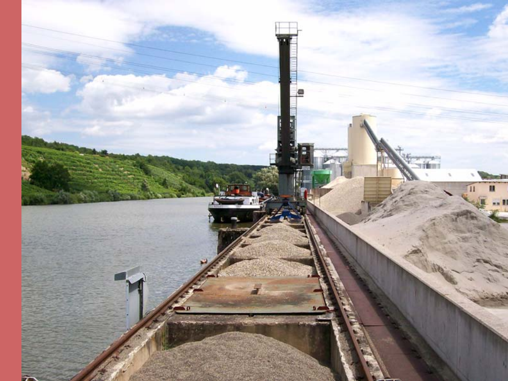
Bild 4: Leider liegen die meisten Industrie- und Gewerbegebiete wie hier in Freiberg direkt am Neckar