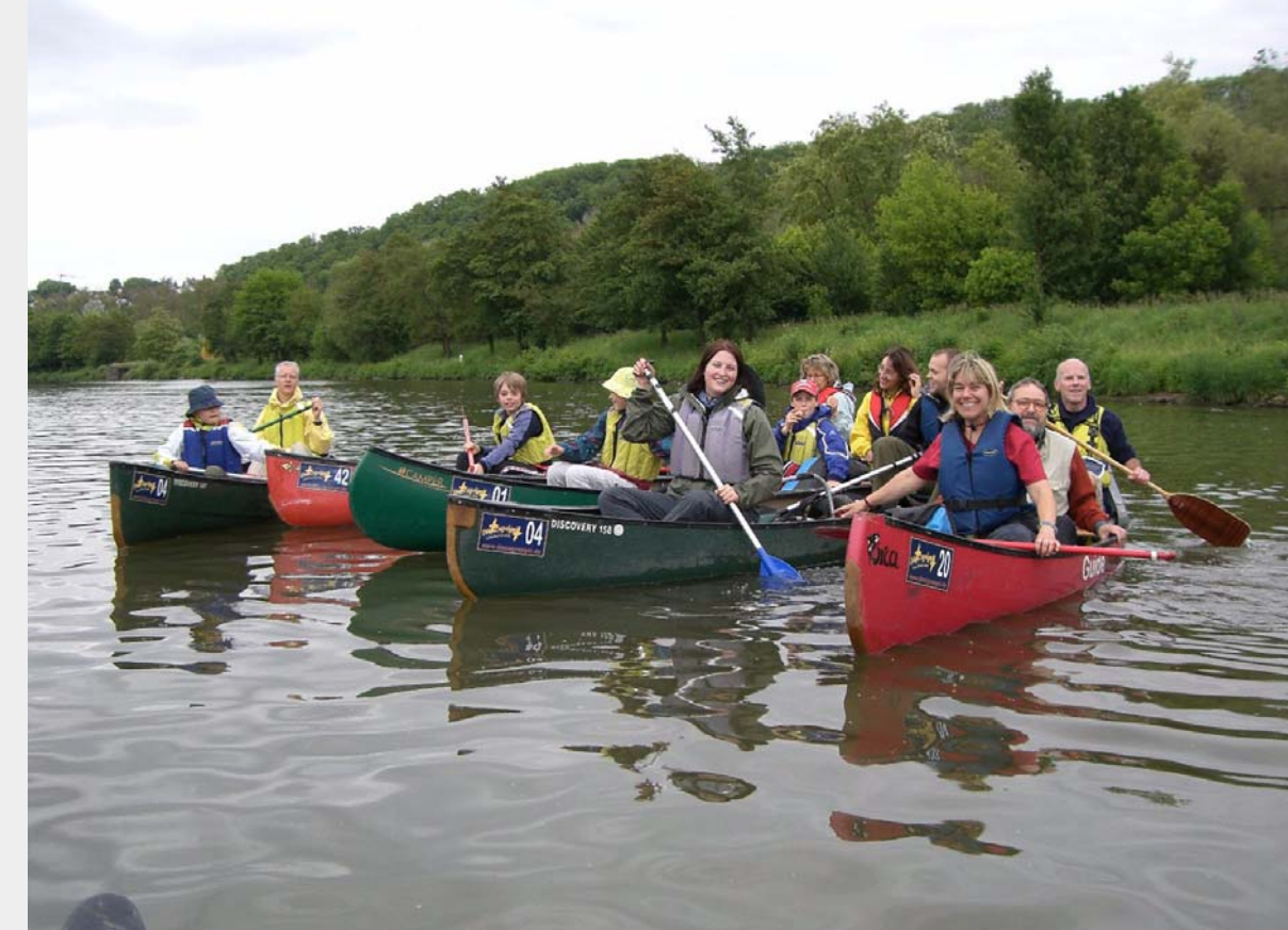
6 Ein Ausflug im Kanu bietet neben Abenteuer für Jung und Alt auch die Möglichkeit den Neckar direkt zu erleben. Leider mangelt es oftmals an der nötigen Infrastruktur wie z.B. Rastplätze, Ein- und Ausstiegsmöglichkeiten