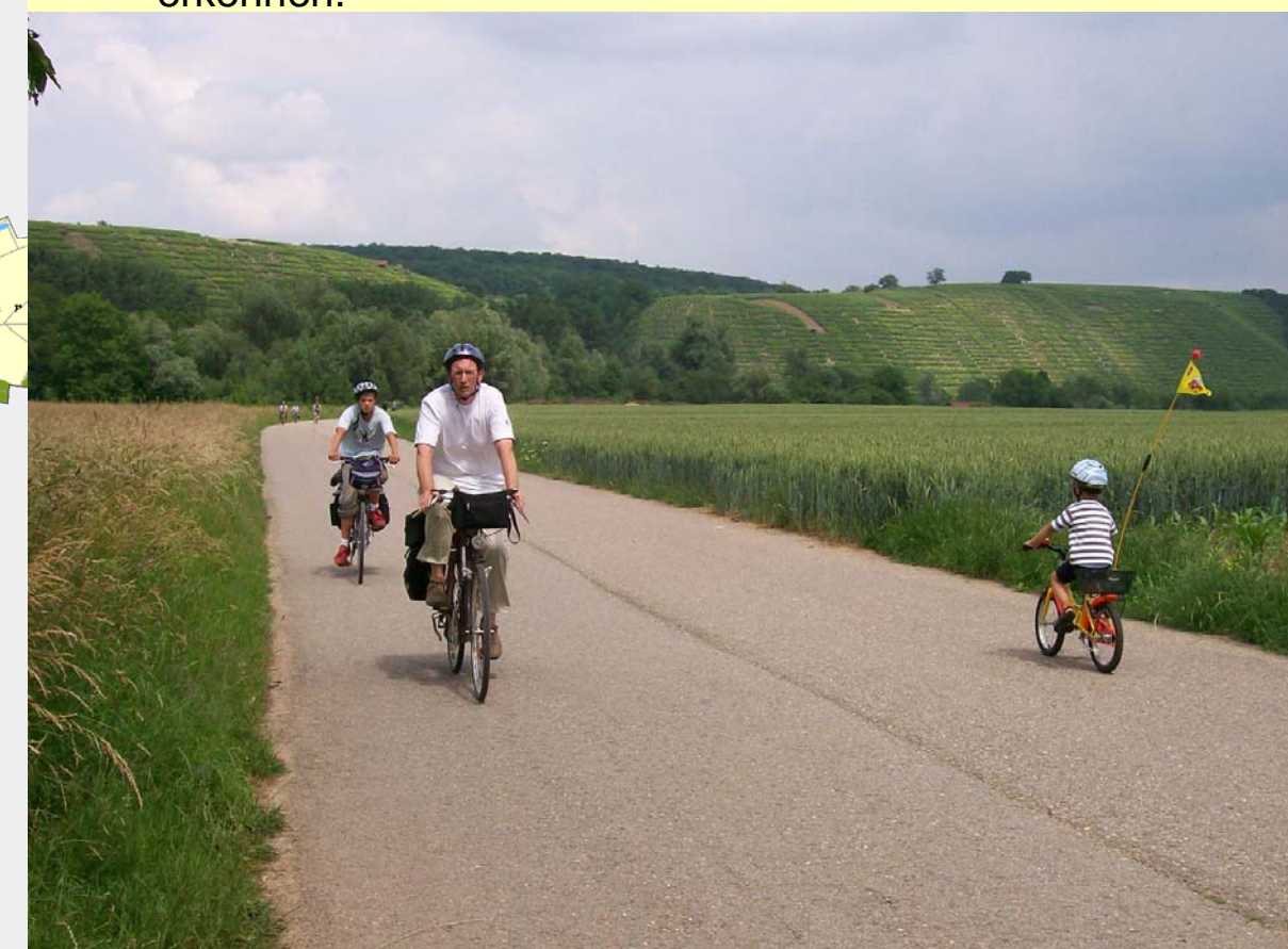
10 Gerade im nördlichen Abschnitt führt der Neckartalradweg durch eine reizvolle, durch den Steillagenweinbau geprägte Landschaft und müsste nur partiell optimiert werden