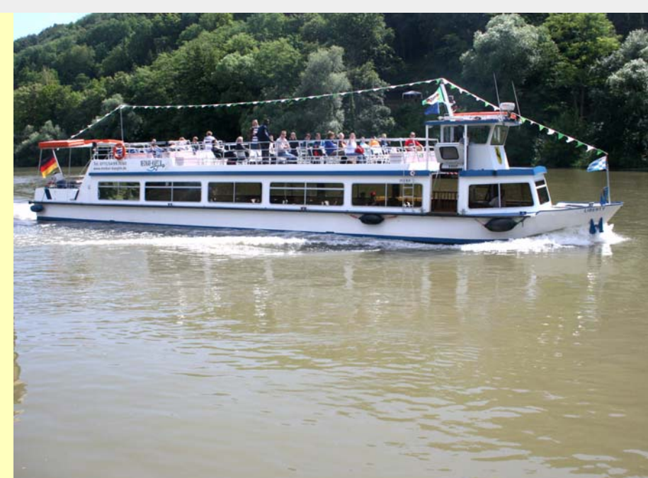
1 Die Flotte des "Neckarkäpt'n" verkehrt zwischen Stuttgart und Besigheim mit drei Linien