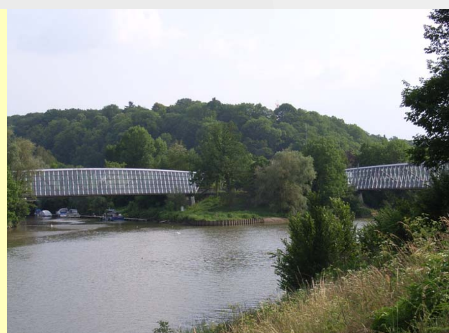
4 Die markanten Fußgängerstege über Rems und Neckar sind hinsichtlich ihrer vernetzenden Wirkung von großer Bedeutung