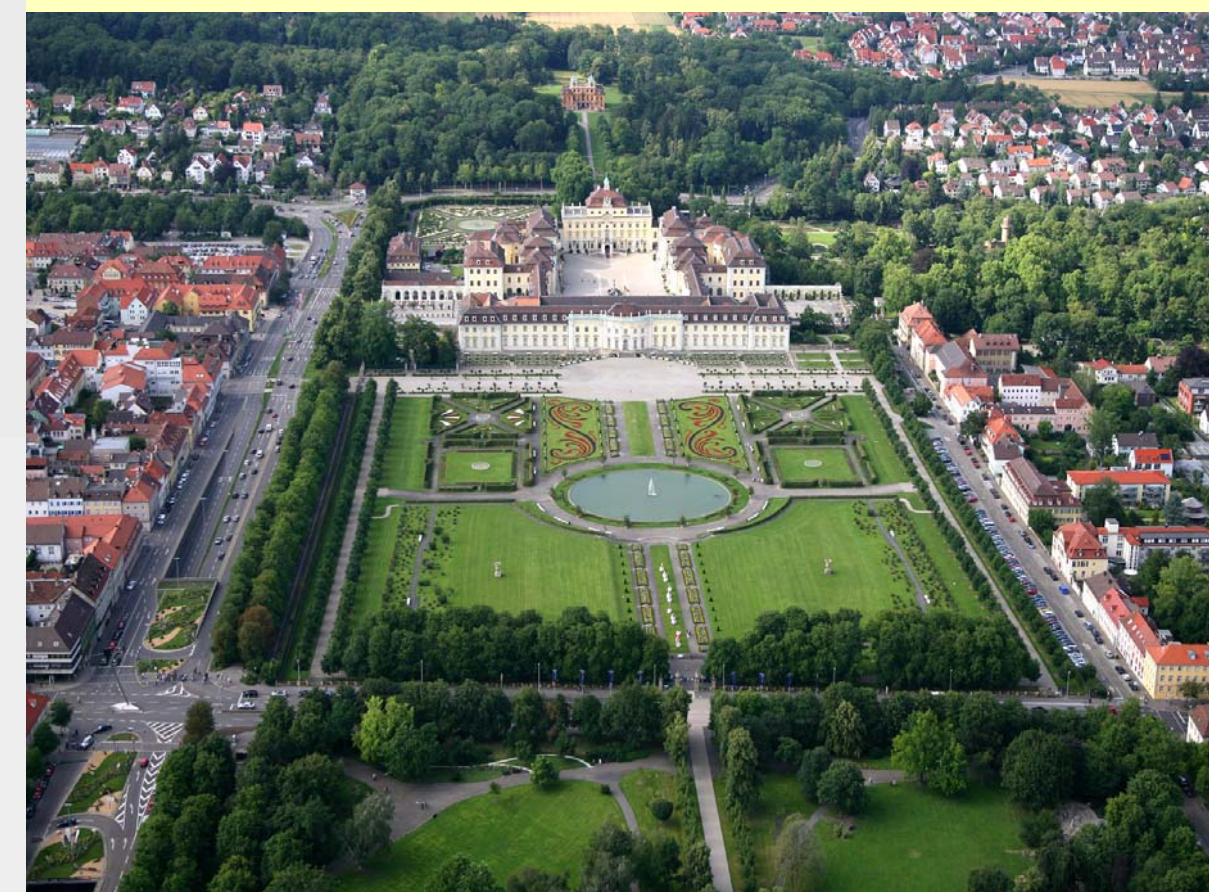
9 Das Ludwigsburger Residenzschloss mit seinem "blühenden Barock" ist ein Anziehungsmagnet für Touristen. Im Hintergrund ist das Jagd- und Lustschloss "Favorite" zu erkennen.