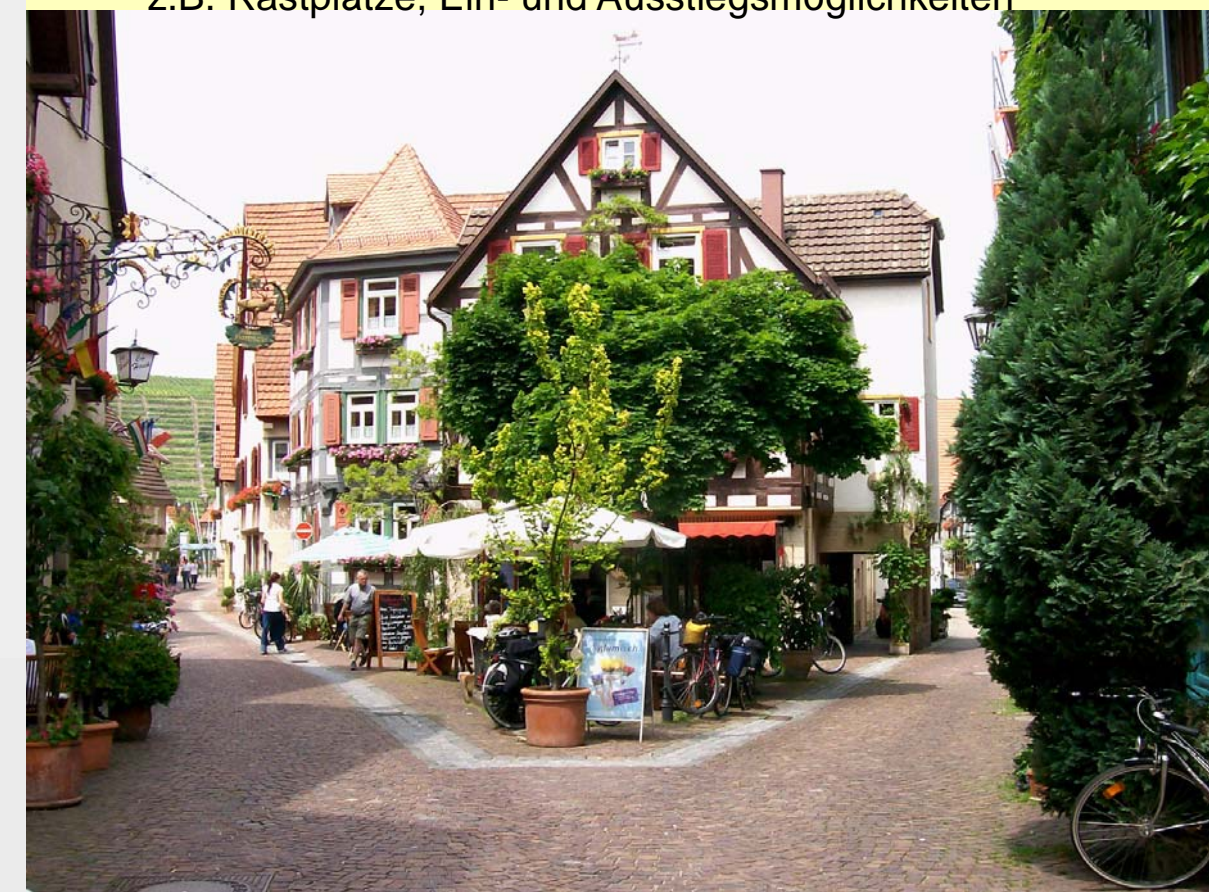
7 Besigheim besitzt eine gut erhaltene historische Altstadt, die idyllisch inmitten von Weinbergen, der Enz und dem Neckar liegt