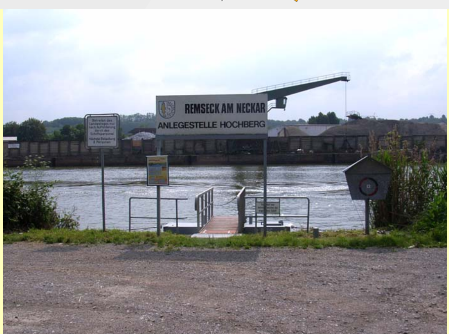
3 Die Anlegestelle "Hochberg" bei Remseck besitzt keine Aufenthaltsqualität und liegt direkt an einer stark befahrenen Straße