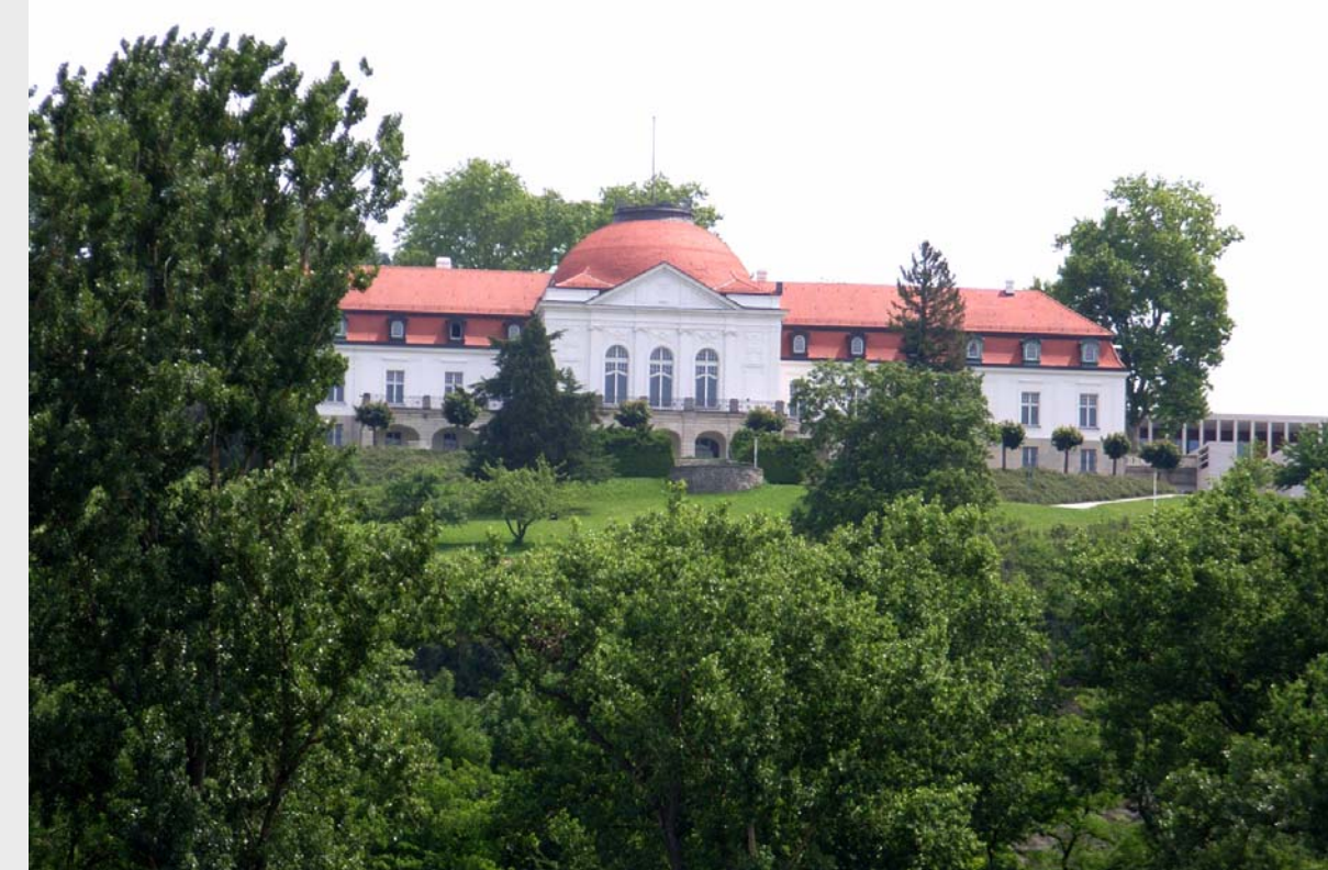
8 Neben dem "Schillernationalmuseum" ist Marbach darüber hinaus mit dem "Literaturmuseum der Moderne" und dem "Deutschen Literaturarchiv" ausgestattet