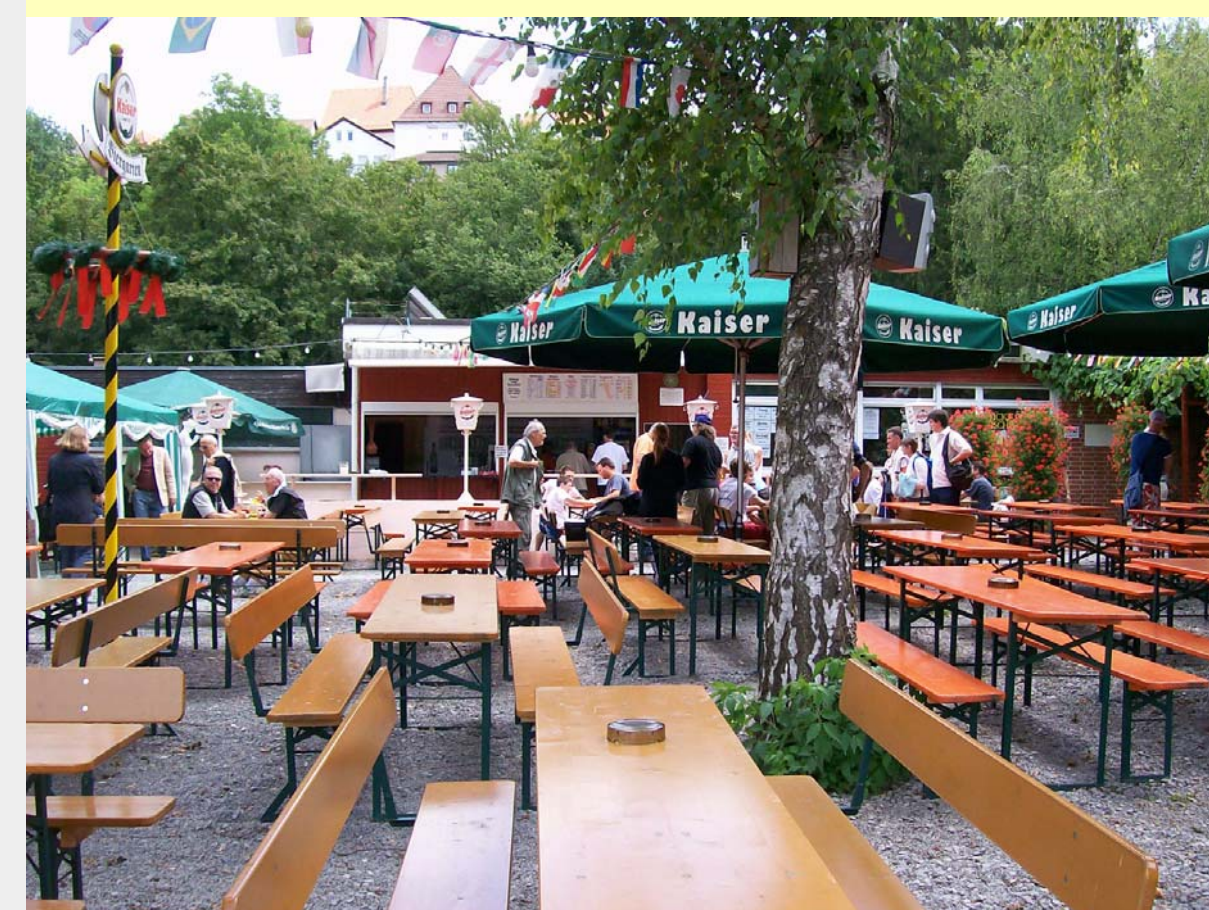
5 Einer der wenigen Biergärten im nördlichen Neckartal befindet sich in der Neckaraue in Marbach