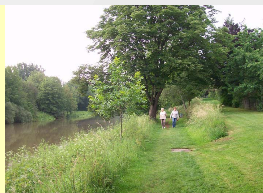
2 Der ortsnahe Neckar begleitende Fußweg bei der Pleidelsheimer Neckarinsel lädt zum Spaziergang ein